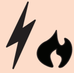
Nhà máy phát

Có các công ty khác nhau sản xuất, phân phối và bán năng lượng