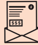
Công ty bán lẻ